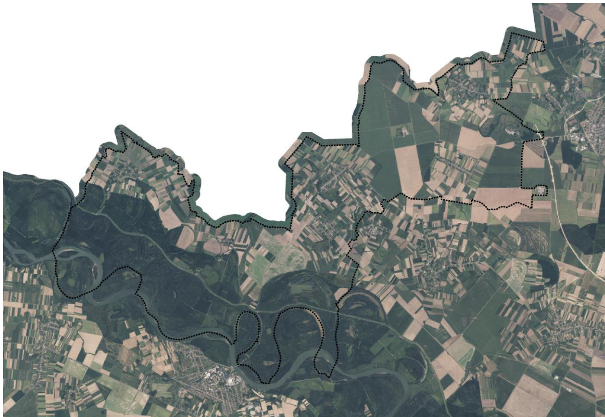
Grafički prikaz broj 1. "Granica obuhvata prostornog plana (administrativna granica Općine Petlovac) iz modula ePlanovi"

Granica dobivena od Državne geodetske uprave je granica obuhvata ovih IV. Izmjena i dopuna PPUO Petlovac čiji je obuhvat vidljiv u modulu Informacijskog sustava prostornog uređenja (ISPU) ePlanovi https://planovi.mgipu.hr/#/auth/prostorni-plan/778/geometrija